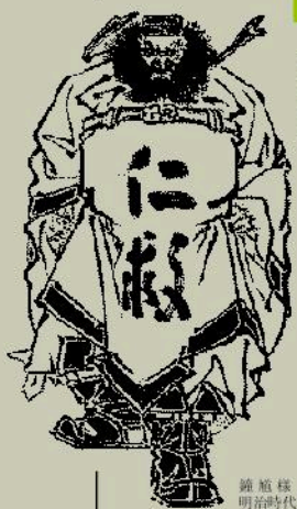
錦旗様 明治時代の版木より

○漢方薬医薬品の販売は、一人一人の人間を大切に救う事ができる神の御業である ○中身は日本一、天下一、神に捧げる品也 ○人を育てるとは、天に通じる心をみがく事にある